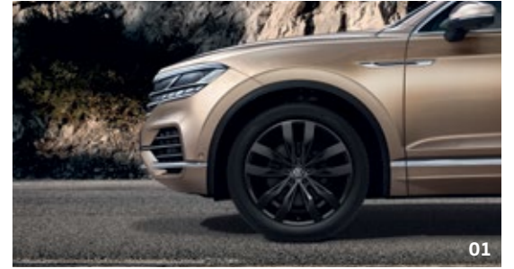
01 عجلات سوزوكا المذهلة قياس 21 بوصة تضفي لمسة تميز على سيارة طوارق R-Line.