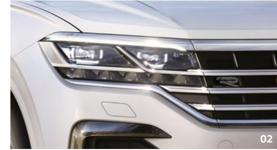
02 ظهور شعار R-Line المميز على شبكة المبرد يعكس الشكل الرياضي والتصميم الصارخ لتجهيزات R-Line.

تمتاز سيارة طوارق R-Line بأفضل التجهيزات من الداخل والخارج. فمزايا الهيكل العديدة تبرز الشخصية الديناميكية للسيارة، ابتداءً من عجلاتها المعدنية المميزة بنظام R-Line قياس 20 - 21 بوصة، وفتحاتها الهوائية الأمامية باللون الأسود اللامع والتي تحمل علامة "C" المميزة ومجموعة R-Line الخارجية مع مصدات أمامية وخلفية مصممة خصيصاً لها، وقوس العجلات بلون هيكل السيارة، وشعار R-Line الظاهر على الألواح والشبكة الأمامية. توفر مجموعة R-Line مظهراً ديناميكياً يضفي على السيارة أعلى مستويات الأناقة والتميز.