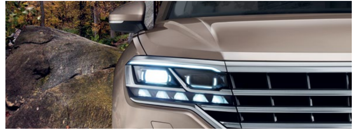
'IQ. Light' مصابيح أمامية بتقنية LED على شكل مصفوفة معززة بأوضاع الإضاءة الذكية ومساعد الإضاءة الديناميكي، جميعها تساهم في رفع درجة إبارة السيارة دون أن تسطع في عين سائق السيارة الأخرى فيحيد نظره عن الطريق، ويتم دمجها في الشبكة الأمامية الواسعة لتمنح السيارة مظهراً واضحاً للغاية.

استطاعت سيارة طوارق أن تضيف لمسة تميز على فئة الـ SUV الفاخرة من خلال الأبعاد الجديدة المبهرة، والتكنولوجيا الرائدة وأوسع مجموعة من أنظمة المساعدة والراحة التي تتألق بها سيارات فولكس واجن. فالمظهر الرياضي الأنيق والمصابيح الخلفية وأنابيب الكروم ذات الشكل الهندسي المميز جميعها معاً تمنح السيارة مظهراً رياضياً جديداً يتألق مع عجلات معدنية قياس 18 - 21 بوصة حسب الطراز الذي تختاره. وبالنسبة لمقدمة السيارة، هناك شبكة واسعة من الكروم التي تعزز المصابيح الأمامية لينتج عنها مظهر أكثر ديناميكية. يضاف إلى هذا، مقصورة Innovision Cockpit ذات المواصفات المبهرة والبراعة المتقنة والتكنولوجيا المتطورة، حيث تمنحك مستويات جديدة من الأداء واللمسات الخاصة، إلى جانب مجموعة "الطرق الوعرة" المبتكرة الاختيارية، وهكذا ستدرك روعة أن تتخطى حدود التوقعات مع سيارة طوارق.